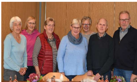
Koch-Teams Recke und Steinbeck